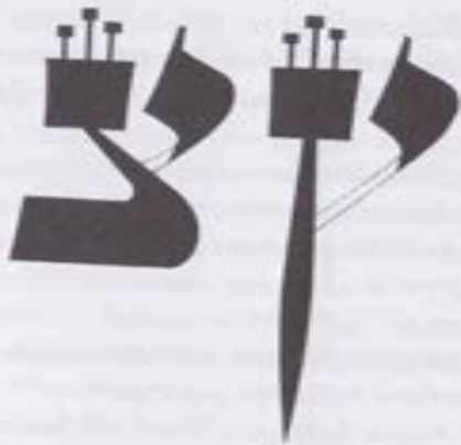
Fig. 6. La Tzadi , donde se muestra cómo se construye a partir de una Nun y una Yod .

Así está escrito ( Proverbios 10,25 ): "El justo ( tzadik ) es el fundamento del mundo".