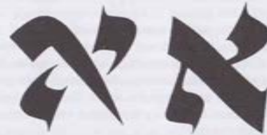
Fig. 7. La Alef consta de dos Yod y una Vav .

La Alef consta de una Yod en el lado superior derecho, una Yod en el lado inferior izquierdo y una línea diagonal separando ambas Yod (véase Fig.1). La Yod superior es la parte superior derecha del cerebro, que es Jojmah-Sabiduría. La Yod de debajo es la pierna izquierda, que es Hod-Esplendor, la fuente de la inspiración y la profecía. La línea tiene la forma de una Vav , que representa a las seis Sefirot intermedias.