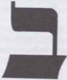
Fig.2. La letra Bet , en donde se ve cómo tiene una cola detrás (a la derecha) y está abierta al frente (#14,15).

Está, pues, escrito ( Proverbios 24,3 ): “Con sabiduría se construye la casa, con entendimiento se establece [y con conocimiento se llenan sus cámaras]”.