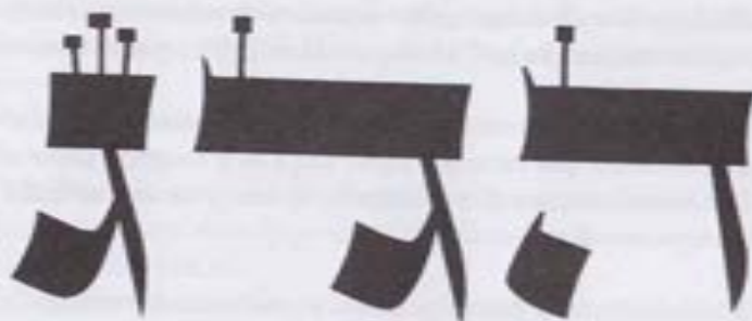
Fig. 4. Cómo la Guimel se transforma en una Dalet , y luego en una Heh (#28).

Él les dijo: Guimel está en el lugar de Dalet , sobre su cabeza está en el lugar de Heh . Dalet con su cola está en el lugar de la Heh 10 .