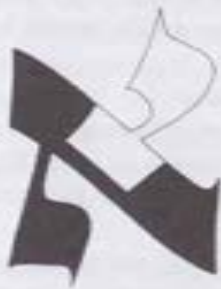
Fig.3. La Alef , mostrando la Bet en su cola. (#15)

Asimismo, si no fuera por la Bet en la cola de la Alef , el mundo no podría existir.