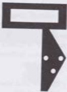
Fig. 5. La Dalet con una Pataj arriba y tres puntos que representan la Segol a un lado (#36).

Así está escrito ( Salmos 24,7): “Las aberturas ( pitjey ) del Mundo”. Allí puso una Pataj arriba y una Segol abajo. Es por esta razón por la que es gruesa.