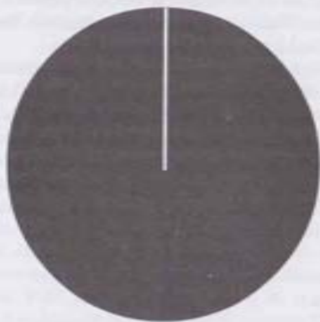
Fig. 1. El Espacio Vacío resultado del Tzimtzum, con el delgado Hilo de Luz que alcanza su centro.

En su sentido literal, el concepto de Tzimtzum es sencillo. Dios primero “retiró” Su Luz, formando un espacio vacío, en el cual toda la creación pudiera tener lugar. Con objeto de que Su poder creativo estuviera en ese espacio, trazó en su interior un “hilo” de Su Luz. A través de este “hilo” tuvo lugar toda la creación.